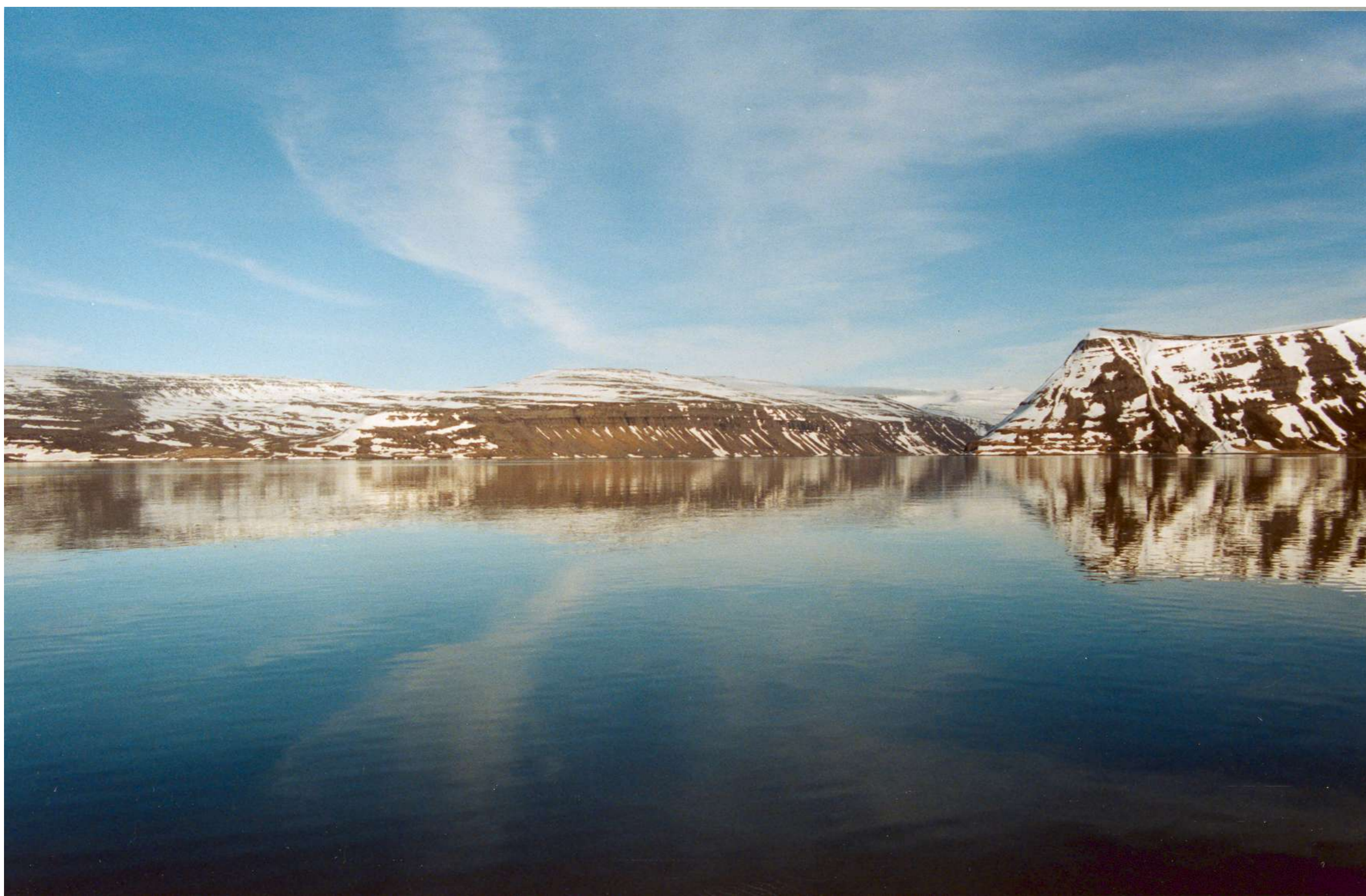
Jökulfirðir 3. mars 2003 (BÞ/NV).

Um vorið 2004 var bæði talið af báti og farið í land í Hesteyrarfirði, Fljótavík og Hornvík.