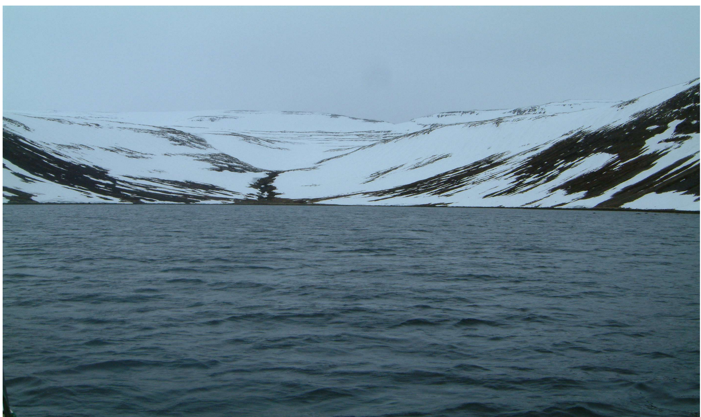
Jökulfirðir 20. maí 2004 (BÞ/NV).

Mest sást af skörfum við Vébjarnarnúp en víða sáust fáeinir fuglar. Nokkur hundruð hávellur sáust í Leirufirði og Hrafnsfirði. Í Lónafirði var nokkuð af svartfugli.